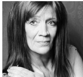
Gunsan Tel. 073471214